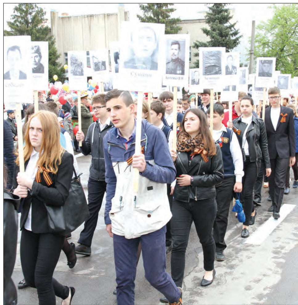
«Бессмертный полк» прошел под аплодисменты благодарных потомков