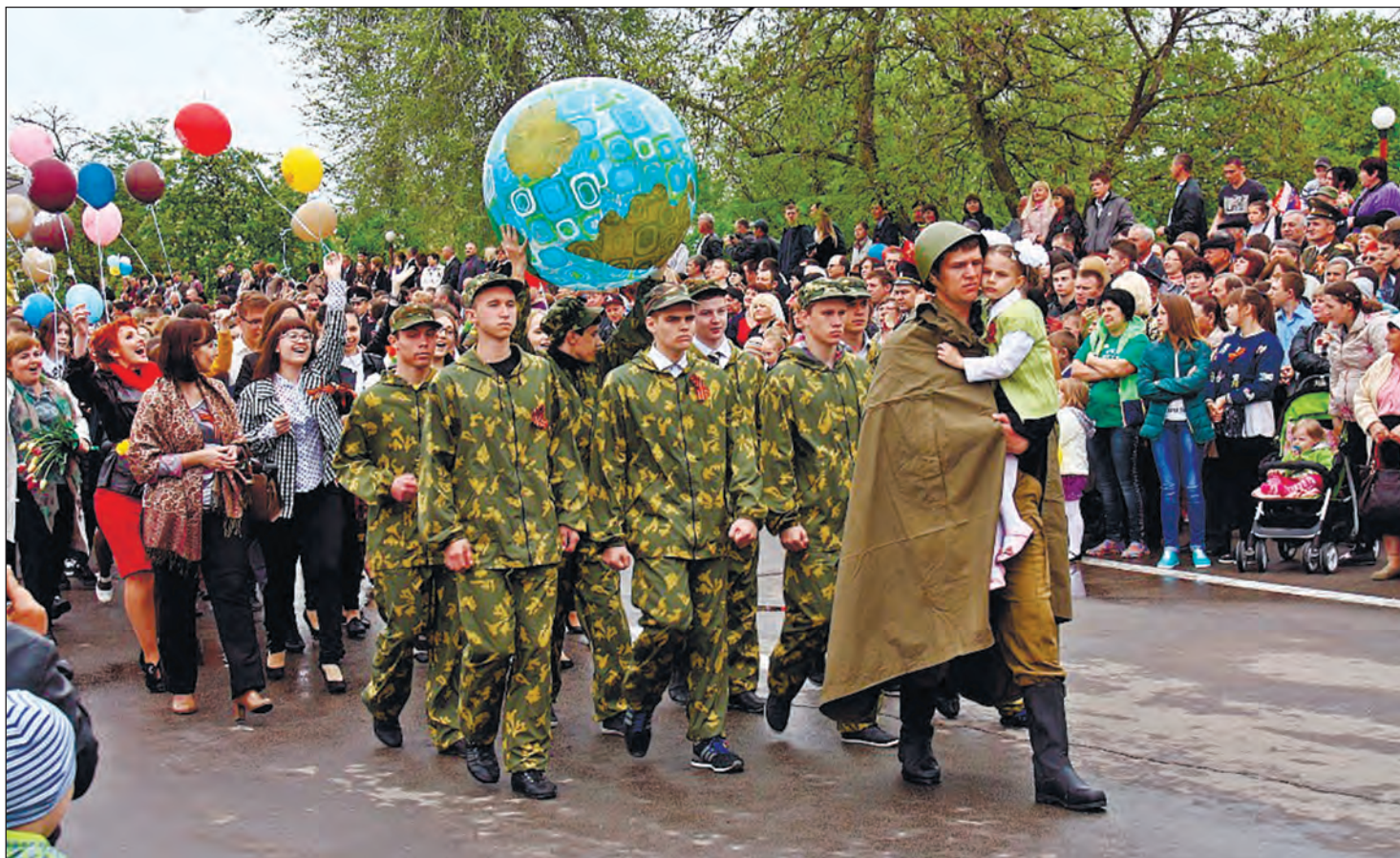
Учащиеся лица представили известный монумент солдата в Трептов-парке в Берлине

9 Мая «Бессмертный полк» возглавил торжественное шествие праздничных колонн. Несколько сотен портретов погибших земляков, солдат, освобождавших