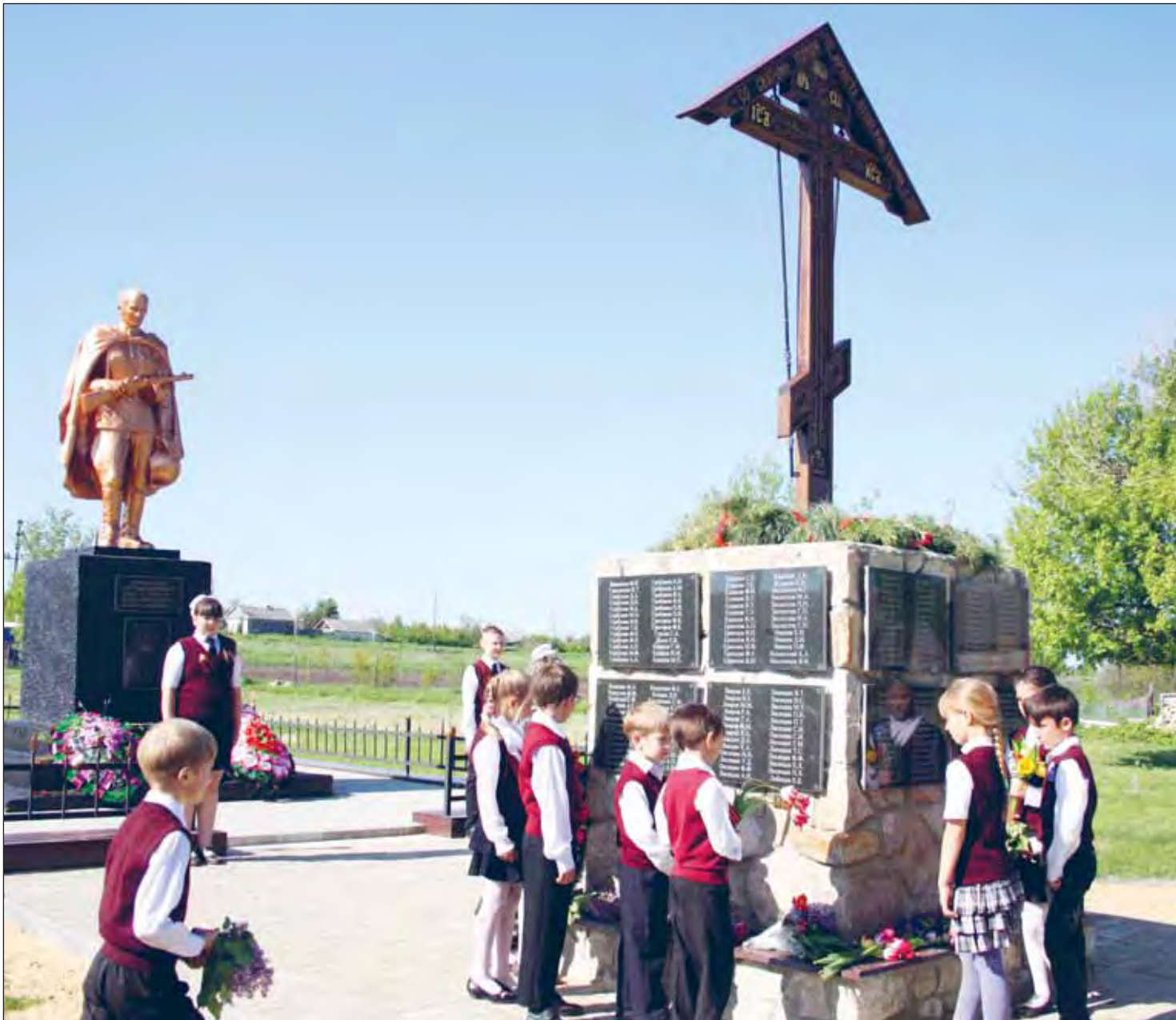
Почтить память своих праотцов ученики Суходонецкой школы приходят и после празднования Дня Победы

Селяне увековечили память 395 земляков, не вернувшихся с фронтов Великой Отечественной войны