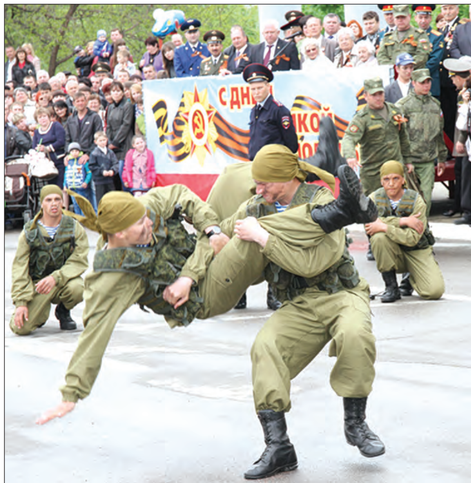
Учебный бой стал захватывающим зрелищем

Информация также размещена на региональном информационном портале РИА «Воронеж» ( www.rivrn.ru ).